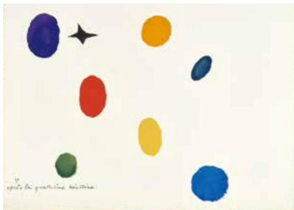
『一羽の小さなカササギがいた』(リーズ・イルツ著)より 1928年