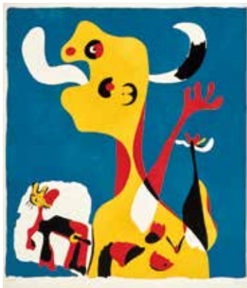
《月の前の女と犬》 1936年