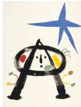
『独り語る』(トリストラン・ツアラの詩)より 1948-50年